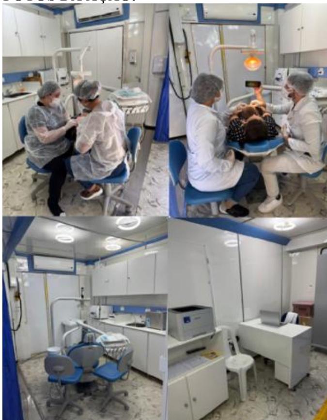
Figura 01. Fotos durante os atendimentos clínicos e estrutura interna do contêiner