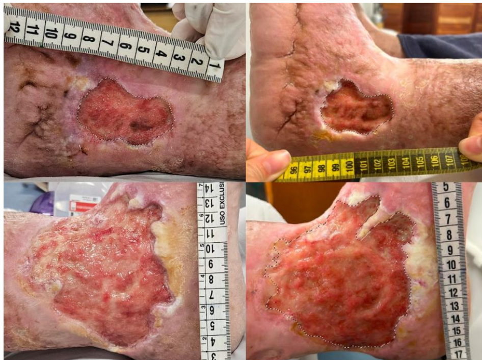
Figura 1 – Registro de evolução da úlcera

CONCLUSÕES: Sendo assim, através deste relato podemos ressaltar a importância de uma prática voltada para o cuidado integral à saúde, disponibilizado na atenção primária que considere aspectos multidimensionais e busque a melhora global da qualidade de vida e capacidade funcional do idoso institucionalizado.