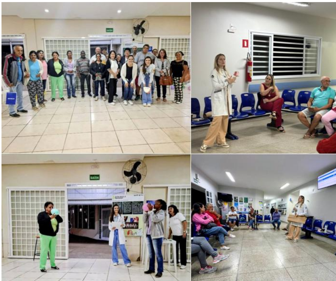
Figura 1: Cirurgiãs-dentistas MSDT desenvolvendo metodologia ativa nos grupos de tratamento do Tabagismo Polo Custódio e Shopping Park 1.